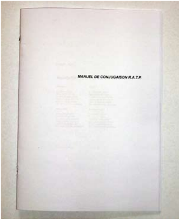
Manuel de conjugaison, édition (600 exemplaires)

Ce document a été conçu à partir de la collecte d'abréviations et d'expressions techniques appartenant au « jargon » des machinistes et des mécaniciens du centre bus de Lagny. Sous forme d'un manuel de conjugaison liant poésie oulipienne et grammaire, elles sont conjuguées dans le but de créer de nouvelles constructions poétiques. Le manuel de conjugaison est à la base un outil scolaire servant à apprendre les différents temps de