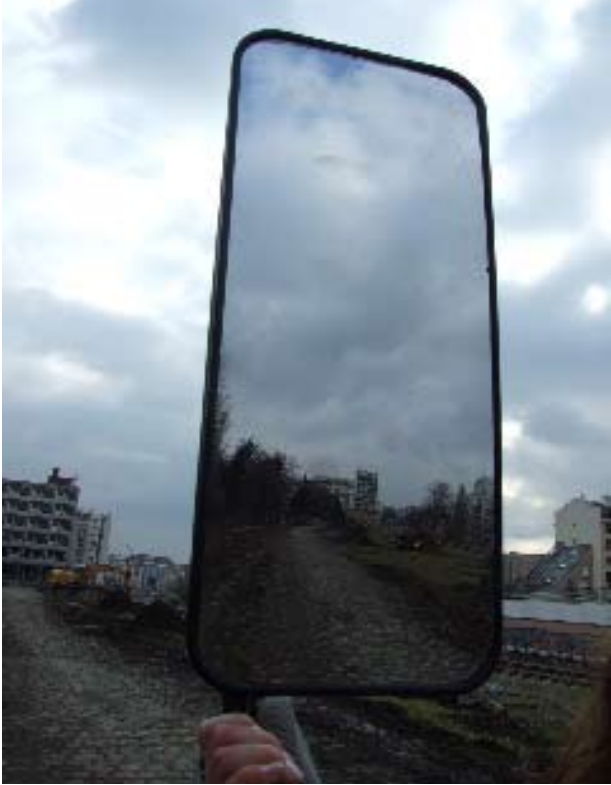
Image du terrain vague qui doit accueillir le centre bus provisoire. Il s'agit d'un cliché saisi dans un rétroviseur de bus, avant le début des travaux d'aménagement.

«Cette photographie est destinée à être placée dans la construction actuelle située rue de Lagny.»