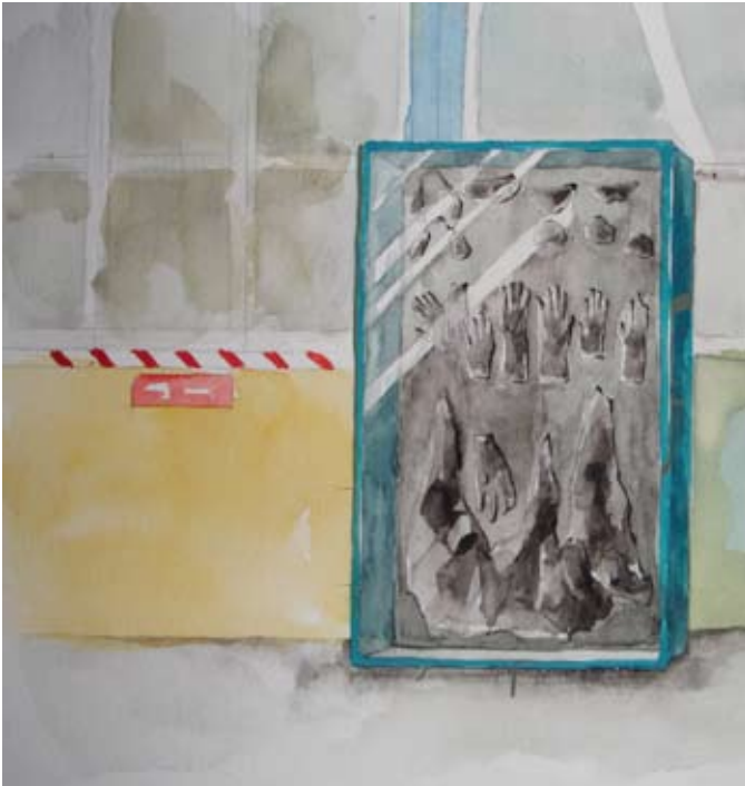
Projet d'installation à partir de moulages des protections utilisées par les mécaniciens.