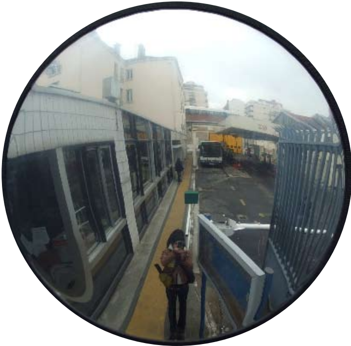
Image du terrain vague qui doit accueillir le centre bus provisoire. Il s'agit d'un cliché saisi dans un rétroviseur de bus, avant le début des travaux d'aménagement.

«Cette photographie est destinée à être placée dans la construction actuelle située rue de Lagny.»