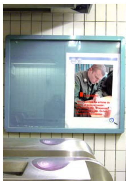
Portraits, affiches dimensions variables